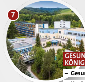
7 GESUNDHEITSRESORT KÖNIGSBERG BAD SCHÖNAU