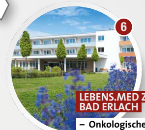
6 LEBENS.MED ZENTRUM BAD ERLACH