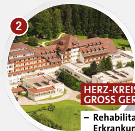
2 HERZ-KREISLAUF-ZENTRUM GROSS GERUNGS