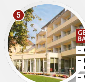
5 GESUNDHEITS- UND KURHOTEL BADENER HOF