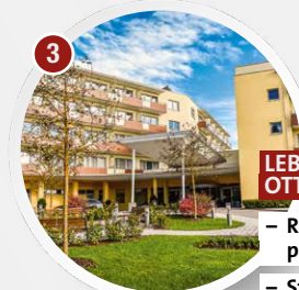
3 LEBENS.RESORT OTTENSCHLAG