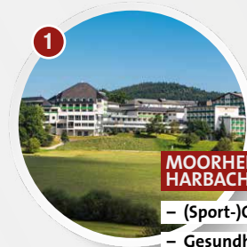
1 MOORHEILBAD HARBACH